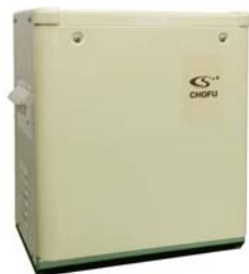
〈 電源ユニット本体 : BDU-300 〉