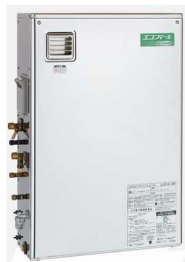
〈 給湯器本体 : EHKF-4751DSX 〉