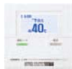
〈 台所リモコン※ 〉