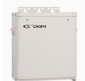
BDU-300 / BDU-301