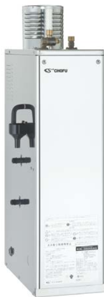
外装：高級ステンレス