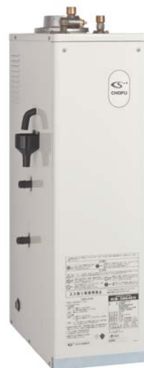
外装：高級粉体塗装 (アイボリー色)