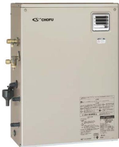
外装：カラー鋼板 (シャンパンゴールド色)