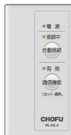
無線アダプターセット(エアコン用)

プレスリリースの内容は発表時のものです。 最新の情報とは異なる場合がございますので、あらかじめご了承ください。