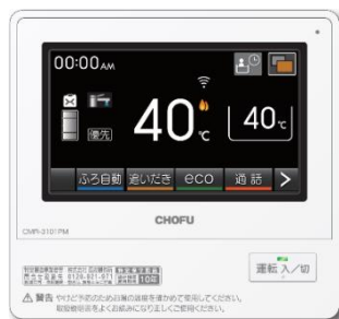
無線内蔵タッチパネルリモコン (給湯器、(冷)温水熱源機用)