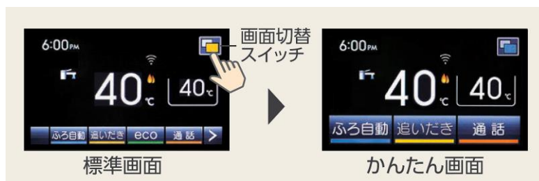
□標準画面・かんたん画面イメージ