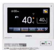
台所リモコン 【CMR-3101PM】 （無線LAN対応）

タッチパネルリモコンを新たにラインアップに追加。よく使うスイッチや情報を大きく表示するかんたん画面への切り替えが可能となり、より使いやすくなりました。